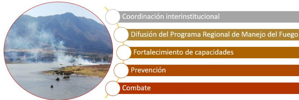
Líneas estratégicas para el manejo integral del fuego en Aipromades Lago de Chapala.

A partir del diagnóstico en el año 2019, se identificaron 5 líneas estratégicas que responden a las necesidades del territorio: Coordinación institucional, Difusión del Programa Regional de Manejo de Fuego, Fortalecimiento de Capacidades, Prevención y Combate.